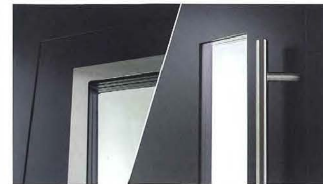
Die Aluminium-Haustürserie „Designline“ zeichnet sich durch eine außen flügelüberdeckende Füllung und einen nur geringen Flächenversatz auf der Innenseite aus.