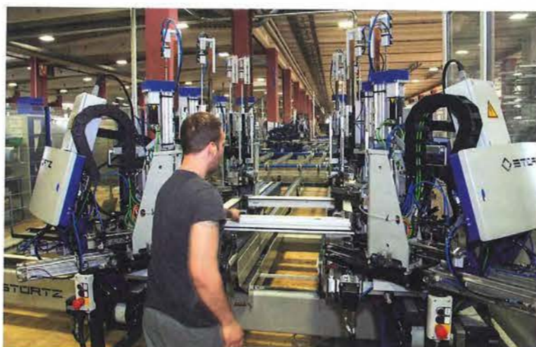
Für die Umsetzung der papierlosen Fertigung nutzt Bayerwald an sämtlichen Arbeitsplätzen das Software-Modul e-prod von Klaes. Im Bild die neue Schweiß-/Putz-Linie, auf der auch Fenster mit Nullfuge produziert werden können.

schleust, um Verbreiterungen anzubringen oder die Aluschalen aufzusetzen. Darüber hinaus wurde ergänzend auch eine Glassortier- und Pufferanlage mit 120 Plätzen installiert.